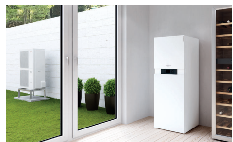
Inneneinheit Vitocaldens 222-F (links) mit Außeneinheit (Typ 222.A29)

Hybrid Pro Control ermittelt diesen Zeitpunkt automatisch und reagiert entsprechend: nach den aktuell eingegebenen Energiekosten für Strom und Gas wird errechnet, welcher Energieträger im Moment am effizientesten eingesetzt werden kann. Hybrid Pro Control hat immer das Gesamtsystem im Blick. Der integrierte Energiemanager ermittelt automatisch die effizienteste Betriebsart (Ökonomie oder Ökologie und Komfort).