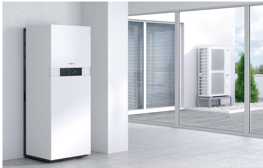
Inneneinheit Vitocaldens 222-F (links) mit Außeneinheit

Viessmann vereint hocheffiziente Brennwerttechnik mit der Nutzung kostenloser Umweltwärme.