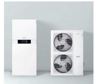
Inneneinheit Vitocaldens 222-F (links) mit Außeneinheiten

*2 Energieeffizienzklasse nach EU-Verordnung Nr. 811/2013 Heizen, durchschnittliche Klimaverhältnisse Niedertemperaturanwendung LT (35 °C)/Mitteltemperaturanwendung MT (55 °C)