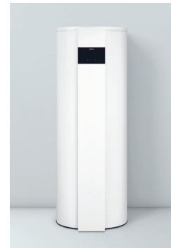
Vitocal 262-A Typen T2E-R290/T2H-R290