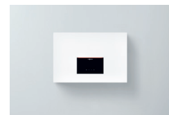
Vitocal 262-A Wandmodul Typ T2W-R290