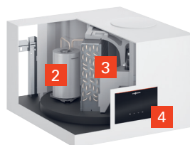
Vitocal 262-A Typ T2W-R290

Hybridvariante mit Wärmetauscher für den Einsatz in Öl-, Gas-, Biomasse- und Fernwärme-Heizungen