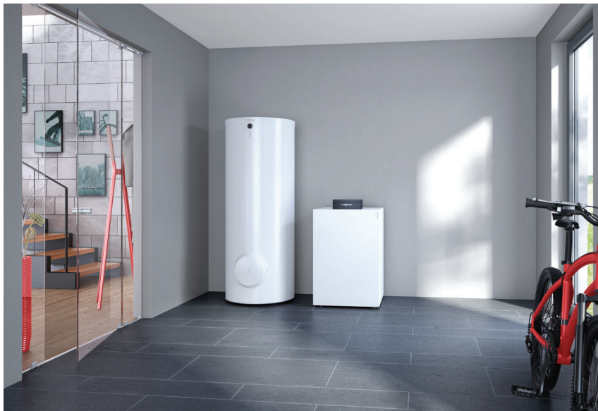
Wärmepumpe Vitocal 200-G mit Speicher-Wassererwärmer Vitocell 100-W (links)

Die preisattraktive Sole/Wasser-Wärmepumpe Vitocal 200-G ist dank ihres leisen Betriebs auch für die wohnraumnahe Aufstellung geeignet.