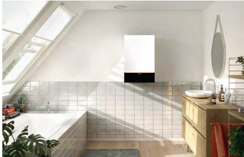
Vitodens 200-W mit attraktivem Design in der Farbe Vitopearlwhite

Vitodens 200-W ist das ideale Gas-Brennwert-Wandgerät für die Eigentumswohnung oder das Einfamilienwohnhaus. Es lässt sich problemlos in einer Nische im Badezimmer oder in einem Küchenschrank montieren. Vitodens 200-W ist mit einem Inox-Radial-Wärmetauscher aus hochwertigem Edelstahl ausgerüstet. Er garantiert Zuverlässigkeit und eine dauerhaft hohe Brennwertnutzung. Das gilt auch für den Matrix-Plus-Brenner.