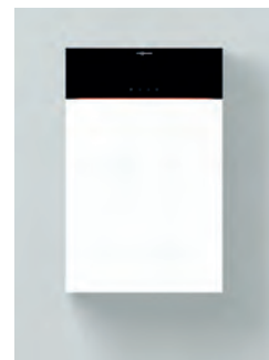
Vitodens 200-W Typen B2HF/B2KF

Komfortable Bedienung auf Augenhöhe durch nach oben versetzbares Display